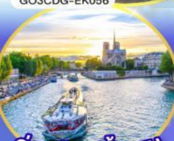
ล่องเรือแม่น้ำเซน