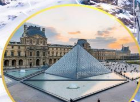
ถ่ายรูปพิพิธภัณฑ์ลูฟวร์