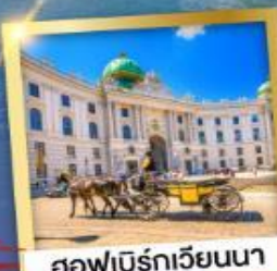
ฮอเฟบิรท์เวียนนา

เข้าชมความงดงามภายใน ของปราสาทนอยชวานสไตน์