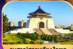
อนุสรณ์สถานเจียง ไคเชก