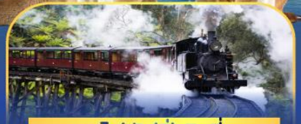
รถไฟพuffบิลลี่

ส่งเรือชมอ่าวซิดนีย์พร้อมรับประทานอาหารกลางวัน และ เข้าชมสวนสัตว์การองก้า