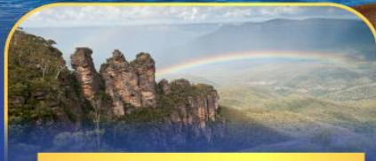
อุทยานแห่งชาติบูนังกาที่แก่ง Three Sister Rock