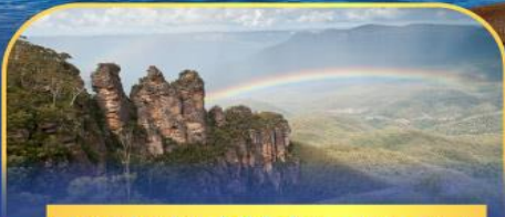
อุทยานแห่งชาติอุลันบูน่าที่เกร็นส์ Three Sister Rock