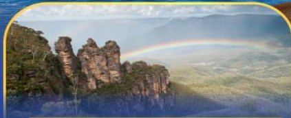
อุทยานแห่งชาติอนุเม้าท์เทิร์นส์ Three Sister Rock