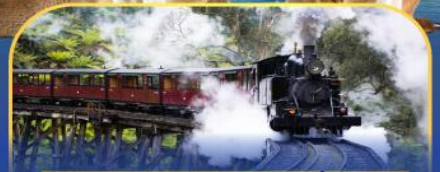
รถไพพพ์ฟิงบิลลี่

ส่งเรือชมอ่าวซิดนีย์พร้อมรับประทานอาหารกลางวัน และ เข้าชมสวนสัตว์การองก้า