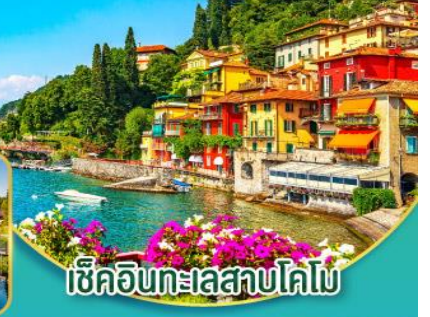
เชิควินทะเลสาบโคโม