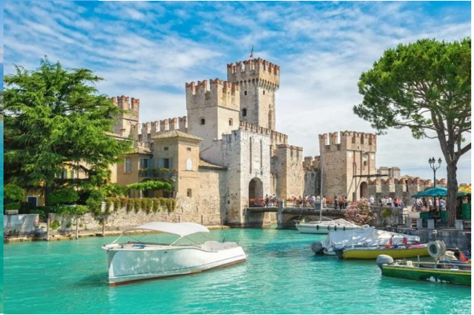
กลางวัน อิสระอาหารกลางวันตามอัธยาศัย