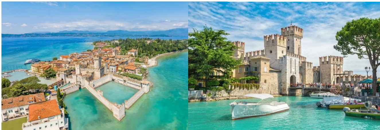
กลางวัน อิสระอาหารกลางวันตามอัธยาศัย