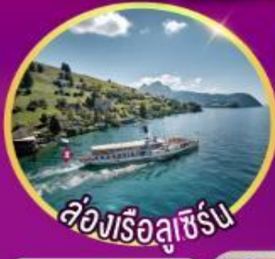
ล่องเรือลูเซิร์น