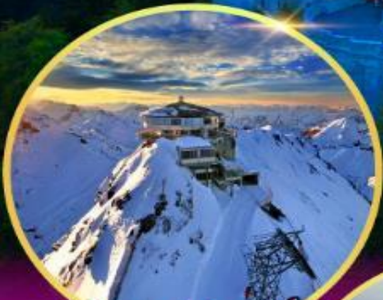
ยอดเขาซิลรอร์น