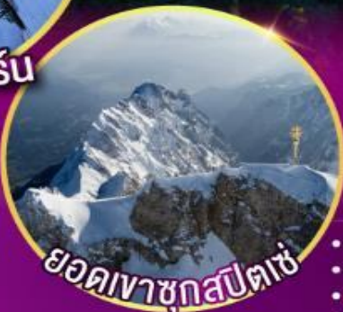
ยอดเขาชุกสปีตเซ่