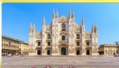
ซอปปิงจุใจที่มิลาน