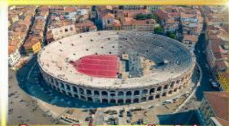
โรงละครโรมันกลางกรุงโรม