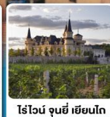
ไร่ไวน์ จุนยี่ เยียนไก