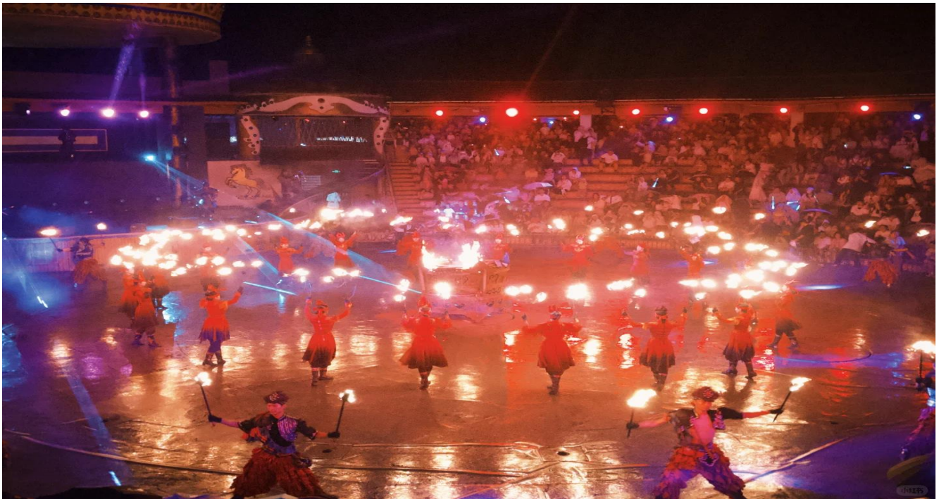
GO1DSN-VZ001 บินตรงแอร์โดส มองโกเลียใน ตะลุยแดนฟุ้งหญ้า ควมม้าทำสายลม 6 วัน 5 คืน โดยสายการบิน ไทย เวียดเจ็ต (VZ)

ลิ้มลองรสชาติความนุ่มละมุนด้วยกรรมวิธีพิเศษ โดยการใช้น้ำแข็งในการต้มเนื้อแกะแทนน้ำเปล่า ซึ่งจะช่วยให้เนื้อแกะมีความสดใหม่ นุ่มเต่ง และรสชาติดีกว่าการปรุงแบบทั่วไป (สำหรับท่านที่ไม่รับประทานเนื้อแกะหรือเนื้อวัว ทางภัตตาคารมีบริการ "เนื้อหมู" ทดแทน)