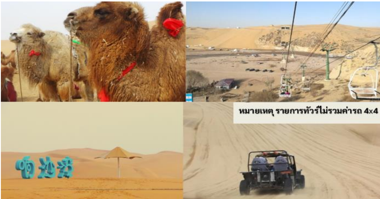
หมายเหตุ รายการทัวร์ไม่รวมค่ารถ 4x4

หมายเหตุ เพื่อความปลอดภัย ทางอุทยานสงวนสิทธิ์ไม่อนุญาตให้ท่านที่มีอายุ เกิน 60 ปี และท่านที่มี ปัญหาเกี่ยวกับโรคกระดูกสันหลัง หรือมีอาการบาดเจ็บที่หลัง เข้าร่วมกิจกรรมนี้ได้ ทั้งนี้ เนื่องจากการชำระค่าตัวแบบเหมารวมบริษัทฯ จึงไม่สามารถคืนค่าใช้จ่ายในส่วนนี้ได้ และต้องขอภัยในความไม่สะดวกมา ณ ที่นี้ และหวังเป็นอย่างยิ่งว่าท่านจะเข้าใจในมาตรการเพื่อความปลอดภัยดังกล่าว