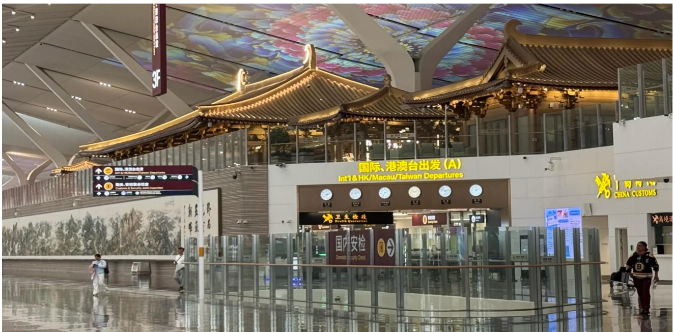
GO1XIY-SL006 บินตรงซิอาน ย้อนเวลาสู่ฉางอัน เจิ้งโจว ลั่วหยาง หยุนไถซาน 6 วัน 5 คืน โดยสายการบิน ไทย โลออนแอร์ (SL)