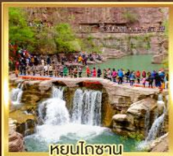
หยุ่นโกซาม