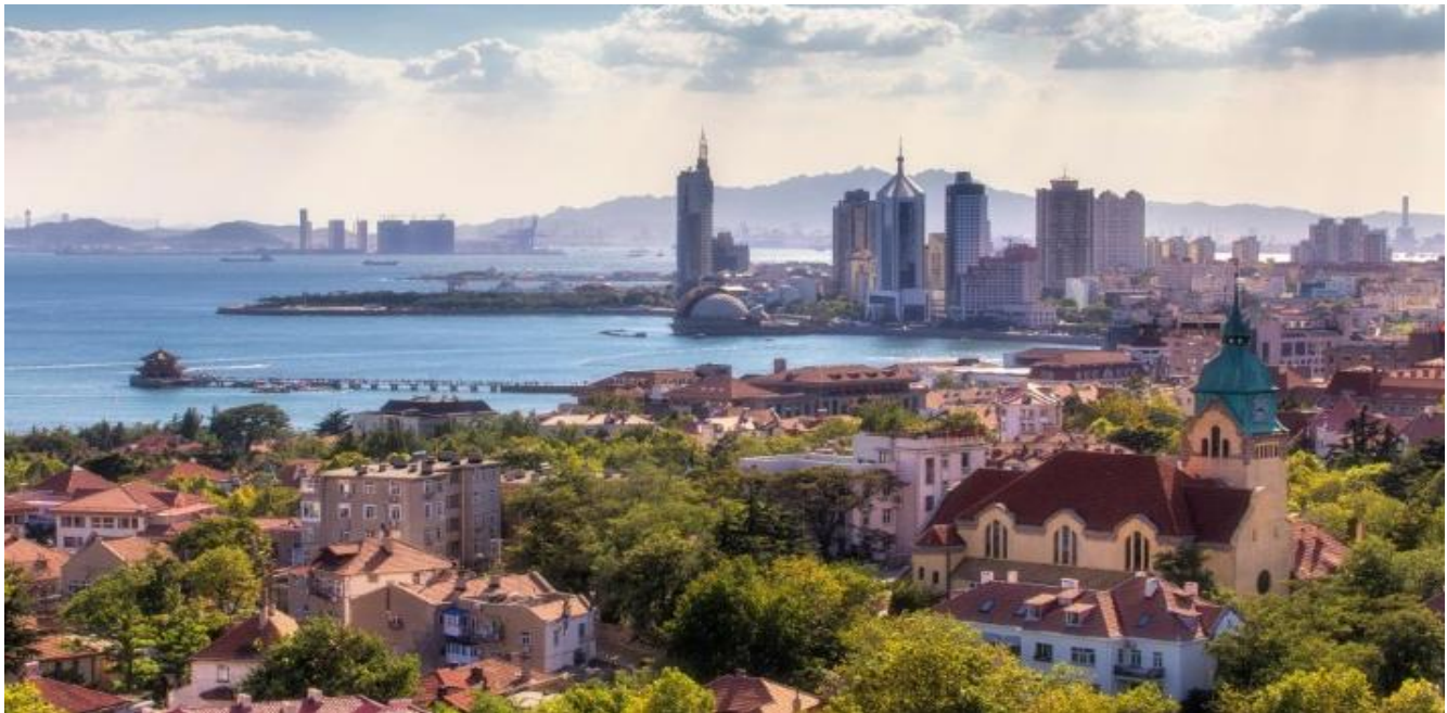
GO1TAO-SC001 บินตรงชิงเต่า สี่เมืองสุดชิค จิบไวน์หรู ดูโรงเบียร์ ชิงเต่า เยียนไถ เฝิงไหล เว่ยไท่ 6 วัน 4 คืน โดย ชานตง แอร์ไลน์ (SC)

08.05 น. เดินทางถึง สนามบินชิงเต่าเจียวตงมณฑลชานตง ที่ซึ่งลมหายใจแห่งยุโรปและจิตวิญญาณจีนบรรจบกัน ริมฝั่งทะเลเหลือง ในมณฑลชานตงอันกว้างใหญ่ มีนครแห่งหนึ่งที่ได้รับการขนานนามว่าเป็น "ทวีปยุโรปแห่งทิศบูรพา" เมื่อนั้นคือ "ชิงเต่า" ที่นี่ไม่ใช่แค่เมืองท่าที่สำคัญ แต่เป็นผืนผ้าใบที่มีชีวิตซึ่งวาดแต่งด้วยสีสันของประวัติศาสตร์อันน่าทึ่ง วัฒนธรรมที่ผสมผสาน และทิวทัศน์ชายทะเลที่งดงามจับใจ เสน่ห์อันเป็นเอกลักษณ์ของชิงเต่าถือกำเนิดจากหน้าประวัติศาสตร์ที่ไม่เหมือนใคร ในช่วงปลายศตวรรษที่ 19 ชิงเต่าซึ่งเดิมเป็นเพียงหมู่บ้านชาวประมงเล็กๆ ได้กลายเป็นเขตเช่าของเยอรมนี แม้จะเป็นช่วงเวลาเพียง 16 ปี แต่ชาวเยอรมันได้วางรากฐานเมืองสมัยใหม่ไว้อย่างมั่นคง ทั้งระบบสาธารณูปโภค ถนนหนทางที่กว้างขวาง และโดยเฉพาะอย่างยิ่ง สถาปัตยกรรมสไตล์ยุโรปที่ยังคงงดงามมาจนถึงทุกวันนี้