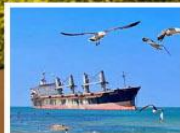
เรือสินค้าเกย์ตันบลูวส์