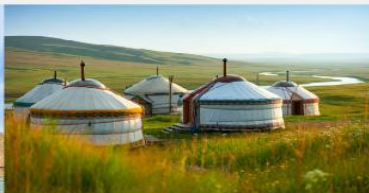
ที่พักแบบกระโจม