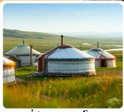
ที่พักแบบกระโจม