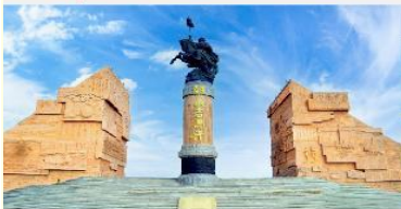
เขตท่องเที่ยวเจงกีสข่าน