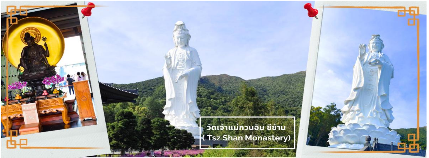
วัดเจ้าแม่กวนอิม ซีซัน (Tsz Shan Monastery)

จากนั้นนำท่านไหว้พระขอพร วัดเจ้าแม่กวนอิม ซีซัน (慈山寺 Tsz Shan Monastery) เจ้าแม่กวนอิมที่ใหญ่ที่สุดเป็นอันดับที่ 2 ของโลก วัดที่เปรียบเสมือนดินแดนสวรรค์บนเกาะฮ่องกง วัดพุทธขนาดใหญ่ที่มีชื่อเสียงมากแห่งหนึ่งของฮ่องกง เป็นที่ประดิษฐานรูปปั้นเจ้าแม่กวนอิมองค์ใหญ่เป็นอันดับสองของโลก เป็นสถานที่ที่มีความศักดิ์สิทธิ์ มีมนต์ขลัง ที่นี่ยังเต็มไปด้วยเรื่องราวของธรรมะ เป็นสถานที่เผยแพร่หลักคำสอนทางพระพุทธศาสนาที่สำคัญของฮ่องกงเลยทีเดียว และเป็นอีกหนึ่งวัดที่อยากแนะนำว่าหากมีโอกาสไปเยือนฮ่องกง จะต้องไม่พลาดที่จะไปสักการะเจ้าแม่กวนอิมขอพรเพื่อความเป็นสิริมงคล ครอบคลุมพื้นที่ 46,764 ตารางเมตร และตัวอาคารต่างๆ ครอบคลุมพื้นที่ประมาณ 5,100 ตารางเมตร ตั้งอยู่บนเนินเขา วิเวกเขาที่อลังการสุดๆ แวดล้อมด้วยวิวทิวทัศน์ธรรมชาติสวยงาม อากาศที่สดชื่นบริสุทธิ์ มาที่เดียวทั้งอิ่มบุญและอิ่มใจกับความงดงามของเจ้าแม่กวนอิม