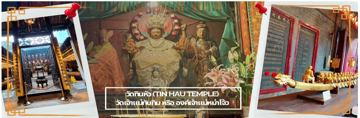
วัดทินหัว (TIN HAU TEMPLE) วัดเจ้าแม่ทับทิม หรือ องค์เจ้าแม่หม่าโจ้ว

จากนั้นนำท่าน ไหว้ขอพรเรื่องเดินทาง การติดต่อ ค้าขาย วัดเจ้าแม่ทับทิมทินหัว (Tin Hau Temple) ที่ Yau Ma Tei เป็นวัดเก่าแก่ขนาดเล็ก อายุกว่า 150 ปี มีต้นกำเนิดมาจากวัดเล็กๆ ใน พื้นที่ตลาด Kwun Chung เคยเป็นหมู่บ้านชาวประมงมาก่อน ตั้งแต่ปี 1864 เป็นวัดที่อุทิศให้กับทินหัว (หม่าโจ้ว เทพเจ้าแห่งท้องทะเล) มีบรรยากาศที่สงบ ร่มรื่น ติดกับสวนสาธารณะเล็ก ๆ และนักท่องเที่ยวยังไม่พุกพลา้นมากจุดเด่นที่แนะนำคือ การปิดทองเรือมังกร เพื่อการงาน การค้า ธุรกิจ ให้เจริญรุ่งเรือง