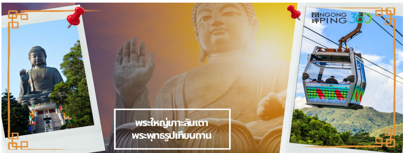
พระใหญ่เกาะลันเตา พระพุทธรูปเทียนถาน

อิสระบริการอาหารกลางวัน ตามอัธยาศัยเพื่อสะดวกในการท่องเที่ยว