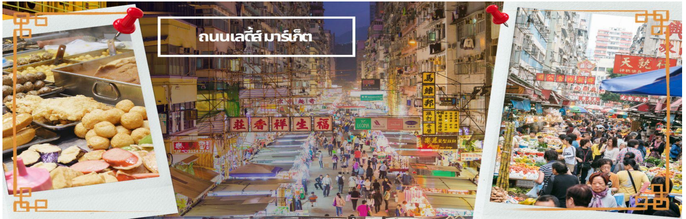
ถนนเลดี้มาร์เก็ต

นำท่านเดินทางเข้าสู่ที่พัก RAMADA GRAND HOTEL/BEST WESTERN PLUS HOTEL ★★★★★ หรือเทียบเท่า ★★★★★ หรือเทียบเท่า