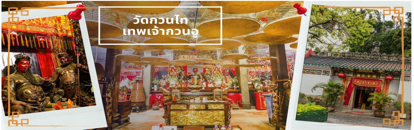
วัดกวนไท เทพเจ้ากวนอู

จากนั้นนำท่าน ไหว้ขอพรเรื่องเดินทาง การติดต่อ ค้าขาย วัดเจ้าแม่ทับทิมทินหัว (Tin Hau Temple) ที่ Yau Ma Tei เป็นวัดเก่าแก่ขนาดเล็ก อายุกว่า 150 ปี มีต้นกำเนิดมาจากวัดเล็กๆ ใน พื้นที่ตลาด Kwun Chung เคยเป็นหมู่บ้านชาวประมงมาก่อน ตั้งแต่ปี 1864 เป็นวัดที่อุทิศให้กับทินหัว (หม่าโจ้ว เทพเจ้าแห่งท้องทะเล) มีบรรยากาศที่สงบ ร่มรื่น ติดกับสวนสาธารณะเล็ก ๆ และนักท่องเที่ยวยังไม่พุกพลา้นมากจุดเด่นที่แนะนำคือ การปิดทองเรือมังกร เพื่อการงาน การค้า ธุรกิจ ให้เจริญรุ่งเรือง