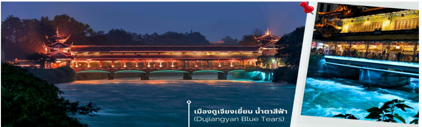
เมืองดูเจียงเยียน น้ำตาสีฟ้า (Dujiangyan Blue Tears)