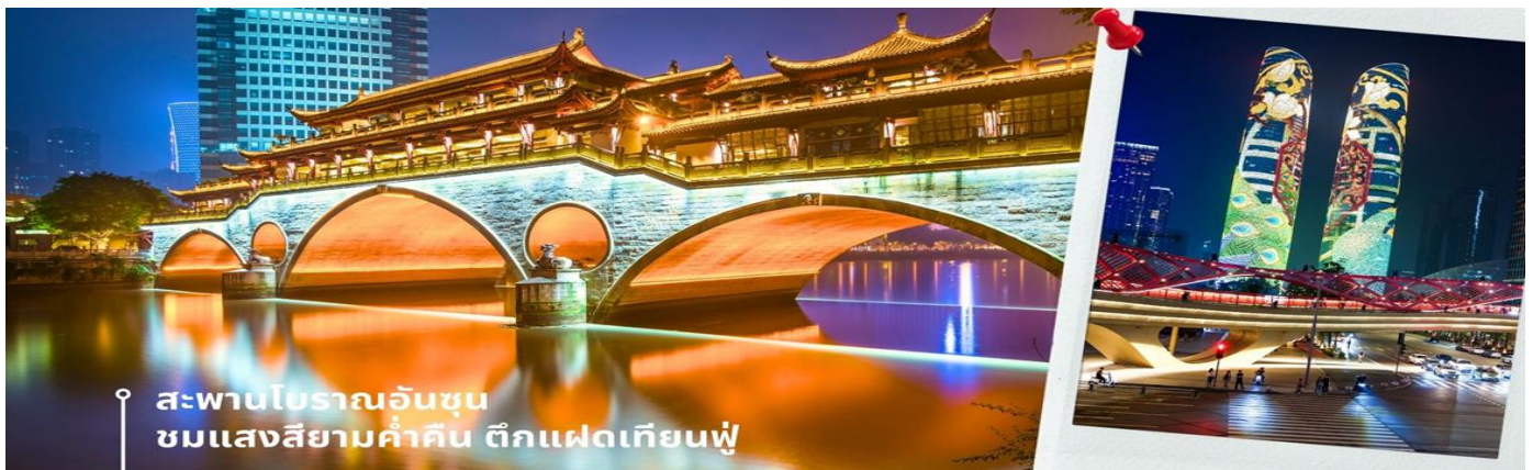
นำท่านเดินทางเข้าที่พัก AC HTL MARRIOTT 4 ดาวหรือเทียบเท่า

นำท่านชม สะพานโบราณอันชุน-พร้อมชมแสงสียามค่ำคืน ตึกแฝดเทียนฟู เป็นสะพานข้ามคลองที่สร้างเป็นเหมือนอาคารอยู่ข้างบน ในช่วงเวลายามเย็นจะเป็นช่วงที่ผู้คนออกมาชมบรรยากาศบริเวณของสะพานแห่งนี้ และมีร้านค้ามากมาย รวมไปถึงบาร์เครื่องดื่มต่างๆ ที่ดึงดูดนักท่องเที่ยวได้เป็นอย่างดี เป็นสะพานที่ทอดข้ามแม่น้ำจินเจียง และเป็นรูปแบบสะพานมีหลังคา ตามลักษณะสถาปัตยกรรมจีนโบราณ อายุมากกว่า 300 ปี และในบริเวณใกล้เคียงกัน ยังเป็นที่ตั้งของ ตึกแฝดเทียนฟู โดยในช่วงค่ำเวลา ประมาณ 19.00–22.00 น. ทั้ง 2 ตึกจะเป็นไฟ LED สวยงามโดดเด่นมาก ตึกแฝดเทียนฟู หรือที่เรียกอย่างเป็นทางการว่าตึกศูนย์การเงินนานาชาติเทียนฟู เป็นตึกระฟ้าที่สวยงามโดดเด่นสองตึกในย่านการเงินของเจิงตู ตึกแต่ละตึกมีความสูง 58 ชั้นและสูงกว่า 700 ฟุต ตึกเหล่านี้โดดเด่นเป็นพิเศษด้วยภายนอกที่หุ้มด้วยไฟ LED ที่เป็นเอกลักษณ์ ซึ่งเปลี่ยนอาคารให้กลายเป็นจอภาพดิจิทัลขนาดใหญ่