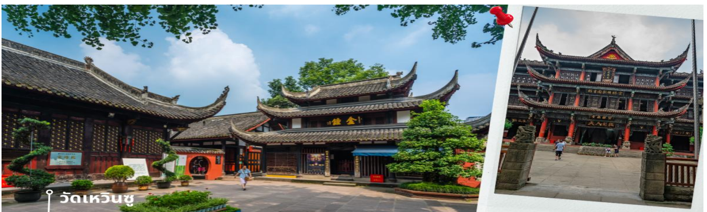
CVZTFU16 เจิงตู เซาซีตรุณี หมี่แพนด้า ธารน้ำสีฟ้า 5วัน 4คืน Vietjet Air (ไม่ลงร้าน) ( JUL 69 – OCT 69)

หลังรับประทานอาหารเช้า นำท่านเดินทางสู่ วัดเหวินซู หรือที่รู้จักกันในชื่อ “พระอารามสง่างาม” เป็นวัดพุทธในเมืองเจิงตูที่อนุรักษ์ไว้ได้อย่างสมบูรณ์ที่สุด มีทิศหน้าไปทางทิศเหนือและใต้ สถาปัตยกรรมแบบดั้งเดิมของที่ราบสูงตะวันตกเฉียงใต้ของจีน สร้างด้วยไม้ อาคารหกชั้นเป็นตัวอย่างของสถาปัตยกรรมสมัยราชวงศ์ซิง การออกแบบของวัด