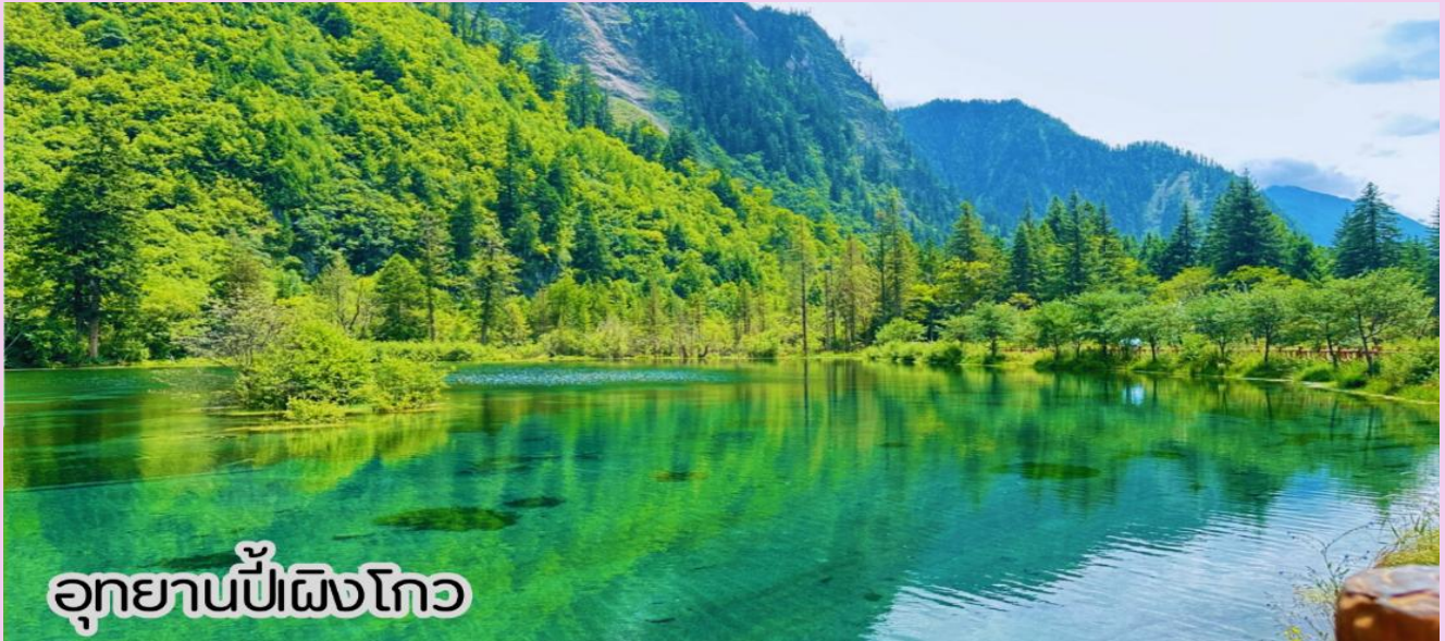
อุทยานปีเฝิงโกว

จากนั้นนำท่านเดินทางไปยัง เมืองทลีเลียน ที่ตั้งอยู่ใกล้กับอุทยานแห่งชาติปีเฝิงโกวและยังเป็นจุดพักสำหรับนักท่องเที่ยวที่เดินทางไปยังปีเฝิงโกว นำท่านสัมผัสสวรรค์แห่งธรรมชาติที่ อุทยานปีเฝิงโกว ค้นพบมนต์เสน่ห์ของอุทยานปีเฝิงโกว สถานที่ที่ธรรมชาติรังสรรค์ความงดงามไว้อย่างน่าทึ่งเพลิดเพลินกับภูเขาหิมะตระการตา ทะเลสาบสีมรกตใสราวกระจก และป่าสีสนสดใสที่เปลี่ยนไปตามฤดูกาล โดยเฉพาะในฤดูใบไม้ร่วงที่ปกคลุมด้วยสีทองแดงและเหลืองระยิบระยับ (รวมรถอุทยาน + รถลอปี่แล้ว)