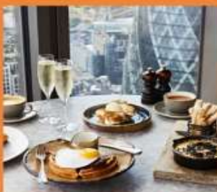
DUCK AND WAFFLE