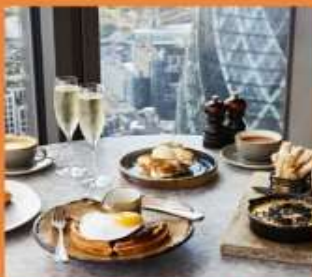
DUCK AND WAFFLE