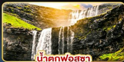
น้ำตกฟอสซา