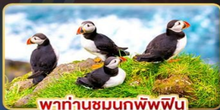
พาท่านชมนกพิพฟิน