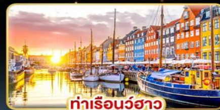
ท่าเรือนูร์ฮาว