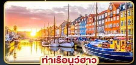
ท่าเรือนูร์ฮาว