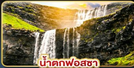
น้ำตกฟอสซา