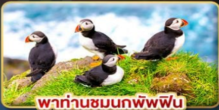
พาท่านชมนกพิพฟิน