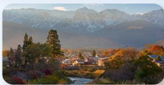
ไออิเดะ ปาร์ค