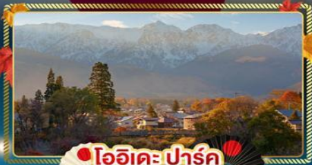
โออิชิ ปาร์ค