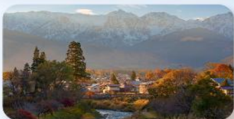
ไออิเดะ ปาร์ค