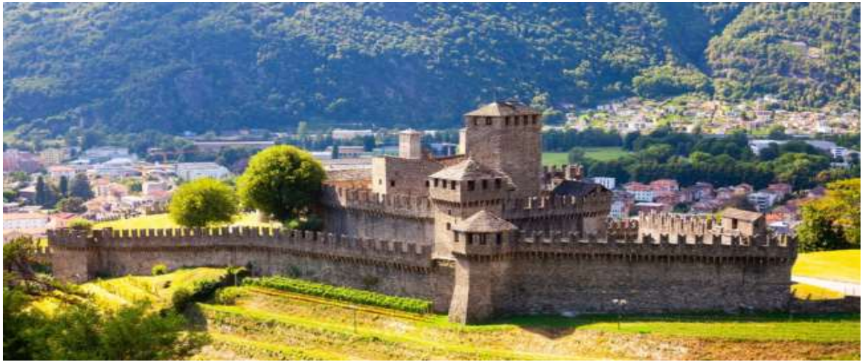
โน เมืองที่ได้รับการขนานนามว่า "เมืองแห่งปราสาท" ชมลานปราสาทจุดชมวิวที่สวยงามของตัวเมืองโดยตัวเมือง

ป้าย นำท่านชม “เมืองเบลลินโซน่า” (Bellinzona) เมืองหลวง แคว้นทิกิโน ตั้งอยู่ทางตอนใต้ของประเทศสวิสฯ โดยมีแนวเทือกเขาแอลป์อันสวยงามเป็นกำแพงกั้นอยู่ระหว่างสวิตเซอร์แลนด์-อิตาลี นำท่านชม “เมืองเบลลินโซน่า (Bellinzona) ได้รับการขึ้นทะเบียนมรดกโลก (Unesco World Heritage) เมืองหลวงที่มีชื่อเสียงของมณฑลทิกิโน