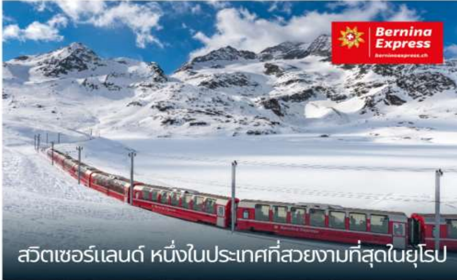
สวิตเซอร์แลนด์ หนึ่งในประเทศที่สวยงามที่สุดในยุโรป

เที่ยวชมสถานที่ท่องเที่ยวที่ยังคง บรรยากาศดั้งเดิมของสวิตเซอร์แลนด์ อันสวยงาม (Unseen Switzerland) นั่งรถไฟและรถรางชมวิว ขบวนที่มีชื่อ เสียงของสวิตเซอร์แลนด์ ถึงสี่ขบวน