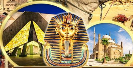
พิพิธภัณฑ์แกรนด์อียิปต์ บ่อนโบราณชาลาติน

เข้าชม 2 พิพิธภัณฑ์ GRAND EGYPTIAN MUSEUM & NMEC พิพิธภัณฑ์โบราณคดีใหม่และพิพิธภัณฑ์จัดแสดงสมัย