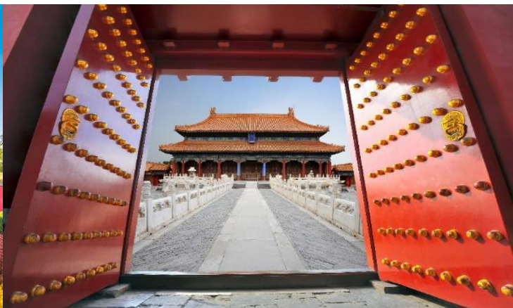
ตั้งอยู่ท่ามกลางสวนที่สวยงาม เต็มไปด้วยต้นไม้ ดอกไม้

**ในกรณีที่พระราชวังต้องห้ามกุ๊กง ไม่สามารถเข้าได้ จำนวนผู้เข้าชมมากเกินกำหนดต่อวัน หรือโดนสั่งปิดจากทางรัฐบาล ภัยพิบัติทางธรรมชาติ และในกรณีอื่นใดก็ตาม ทั้งนี้ ทางบริษัทฯ ขอสงวนสิทธิ์ปรับเป็น ชมพระราชวังองค์ชายน้อย โดยคำนึงถึงความปลอดภัยของท่านเป็นหลัก แทนโดยไม่แจ้งให้ทราบล่วงหน้า ทุกกรณี