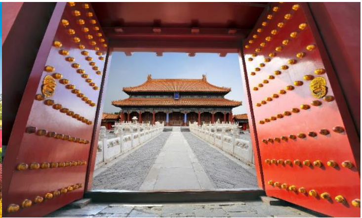
ตั้งอยู่ท่ามกลางสวนที่สวยงาม เต็มไปด้วยต้นไม้ ดอกไม้

**ในกรณีที่พระราชวังต้องห้ามกุ๊กง ไม่สามารถเข้าได้ จำนวนผู้เข้าชมมากเกินกำหนดต่อวัน หรือโดนสั่งปิดจากทางรัฐบาล ภัยพิบัติทางธรรมชาติ และในกรณีอื่นใดก็ตาม ทั้งนี้ ทางบริษัทฯ ขอสงวนสิทธิ์ปรับเป็น ชมพระราชวังองค์ชายน้อย โดยคำนึงถึงความปลอดภัยของท่านเป็นหลัก แทนโดยไม่แจ้งให้ทราบล่วงหน้า ทุกกรณี