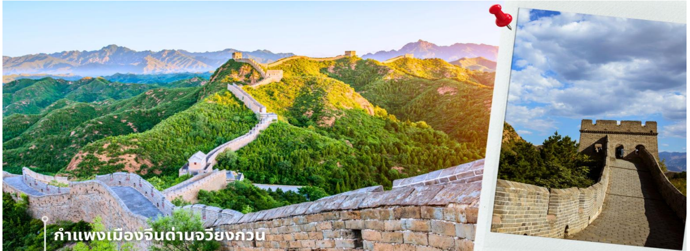
กำแพงเมืองจีนด่านจิวยงกวน

กรุงปักกิ่งมีการรุกรานจากชนเผ่าเร่ร่อน ด้านจิวหยิงกวนมีสถาปัตยกรรมที่สวยงามของศิลปะจีน จากยอดดาดำ สามารถมองเห็นทิวทัศน์ที่สวยงามของเทือกเขาและธรรมชาติโดยรอบ นับว่าเป็น 1 ใน 8 จุดชมวิวที่มีชื่อเสียงของปักกิ่งมาตั้งแต่สมัยราชวงศ์ฉิน