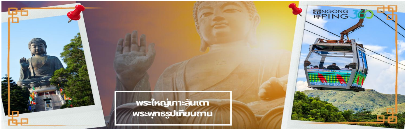
พระใหญ่เกาะลันเตา พระพุทธรูปเทียนถาน

เช้า 📍 บริการอาหารเช้า ณ ภัตตาคาร **เมนูติ่มซำต้อนรับฮ่องกง** (5) จากนั้นเดินทางสู่เกาะลันเตา เพื่อไปที่สถานีตุงซุง ท่านจะได้สัมผัสกับประสบการณ์ที่น่าตื่นตาตื่นใจจาก กระเช้าลอยฟ้านองปิง (NGONG PING SKYRAIL 360 **STANDARD CABIN**) ซึ่งถือได้ว่าเป็นแหล่งท่องเที่ยวอันมีเอกลักษณ์ระดับโลกของฮ่องกง ที่มีระยะทางกว่า 5.7 กิโลเมตร ใช้เวลาประมาณ 25 นาที ท่านจะได้สัมผัสบรรยากาศจากบนกระเช้ามุมสูง เส้นทางกระเช้าเชื่อมจากใจกลางเมืองตุงซุง ถึง หมู่บ้านวัฒนธรรมนองปิง บนเกาะลันเตา ท่านจะได้ชมวิวแบบพาโนรามา 360 องศา ของสนามบินนานาชาติฮ่องกง ทิวทัศน์เหนือท้องทะเลของทะเลจีนใต้ ชมวิวของเนินเขา