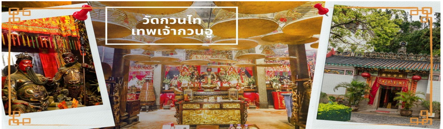
วัดกวนโถ เทพเจ้ากวนอู

จากนั้นนำท่าน ไหว้ขอพรเรื่องเดินทาง การติดต่อ ค้าขาย วัดเจ้าแม่ทับทิมทินหัว (Tin Hau Temple) ที่ Yau Ma Tei เป็นวัดเก่าแก่ขนาดเล็ก อายุกว่า 150 ปี มีต้นกำเนิดมาจากวัดเล็กๆ ใน พื้นที่ตลาด Kwun Chung เคยเป็นหมู่บ้านชาวประมงมาก่อน ตั้งแต่ปี 1864 เป็นวัดที่อุทิศให้กับทินหัว (หมาจิ้งจอก เทพเจ้าแห่งท้องทะเล) มีบรรยากาศที่สงบ ร่มรื่น ติดกับสวนสาธารณะเล็ก ๆ และนักท่องเที่ยวยังไม่พลุกพล่านมากจุดเด่นที่แนะนำคือ การปิดทองเรือมังกร เพื่อการงานการค้า ธุรกิจ ให้เจริญรุ่งเรือง