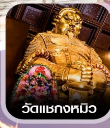
วัดชกหมี

✈️ คอนเฟิร์มออกเดินทาง ✈️ ทุกพีเรียด 2 ท่านขึ้นไป