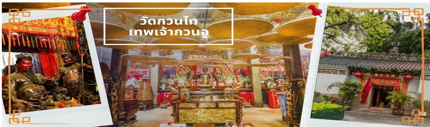
วัดกวนไท เทพเจ้ากวนอู

จากนั้นนำท่าน ไหว้ขอพรเรื่องเดินทาง การติดต่อ ค้าขาย วัดเจ้าแม่ทับทิมทินหัว (Tin Hau Temple) ที่ Yau Ma Tei เป็นวัดเก่าแก่ขนาดเล็ก อายุกว่า 150 ปี มีต้นกำเนิดมาจากวัดเล็กๆ ใน พื้นที่ตลาด Kwun Chung เคยเป็นหมู่บ้านชาวประมงมาก่อน ตั้งแต่ปี 1864 เป็นวัดที่อุทิศให้กับทินหัว (หมาจิ้งจอก เทพเจ้าแห่งท้องทะเล) มีบรรยากาศที่สงบ ร่มรื่น ติดกับสวนสาธารณะเล็ก ๆ และนักท่องเที่ยวยังไม่พลาดผ่านมากจุดเด่นที่แนะนำคือ การปิดทองเรือมังกร เพื่อการงานการค้า ธุรกิจ ให้เจริญรุ่งเรือง