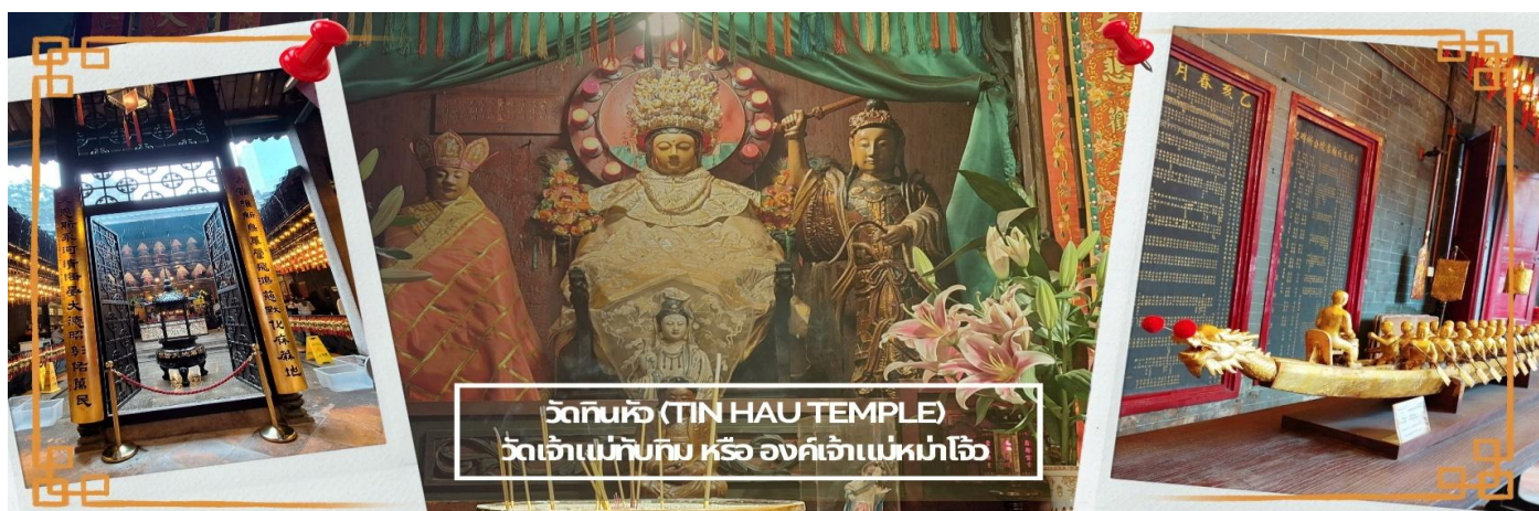
วัดทินหัว (TIN HAU TEMPLE) วัดเจ้าแม่ทับทิม หรือ องค์เจ้าแม่หม่าโจ้ว

จากนั้นนำท่าน ไหว้ขอพรเรื่องเดินทาง การติดต่อ ค้าขาย วัดเจ้าแม่ทับทิมทินหัว (Tin Hau Temple) ที่ Yau Ma Tei เป็นวัดเก่าแก่ขนาดเล็ก อายุกว่า 150 ปี มีต้นกำเนิดมาจากวัดเล็กๆ ใน พื้นที่ตลาด Kwun Chung เคยเป็นหมู่บ้านชาวประมงมาก่อน ตั้งแต่ปี 1864 เป็นวัดที่อุทิศให้กับทินหัว (หมาจิ้งจอก เทพเจ้าแห่งท้องทะเล) มีบรรยากาศที่สงบ ร่มรื่น ติดกับสวนสาธารณะเล็ก ๆ และนักท่องเที่ยวยังไม่พลาดผ่านมากจุดเด่นที่แนะนำคือ การปิดทองเรือมังกร เพื่อการงานการค้า ธุรกิจ ให้เจริญรุ่งเรือง