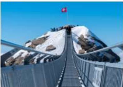
พิชิตยอดเขาคิตลิส (Titlis Mt.)

นำท่านโดยสารกระเช้าหมุนไฟฟ้า Rotair Titlis ที่หมุนได้ 360 องศา รุ่นใหม่ล่าสุด ระหว่างขบวนวิ่งทั่วทิศของ เขาคิตลิส เออปี ที่ มีความสวยงามของยอดเขาคิตลิส มีความ สูง 3,028 เมตร ปกคลุมไปด้วยหิมะตลอดทั้ง ปี เป็นยอดเขาคิตลิสที่มีนักท่องเที่ยวนิยมมาเล่น สกีและทำกิจกรรมบนหิมะเป็นจำนวนมาก