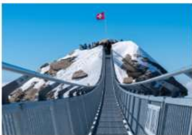
พิชิตยอดเขากิตลิส (Titlis Mt.)

นำทำนโดยสารกระเช้าหมุนไฟฟ้า Rotair Titlis ที่หมุนได้ 360 องศา รุ่นใหม่ล่าสุดระหว่างชมทิวทัศน์ของ เขอกเขาแอลป์ ที่มีความสวยงามของยอดเขากิตลิส มีความสูง 3,028 เมตร ปกคลุมไปด้วยหิมะตลอดทั้งปี เป็นยอดเขากิตลิสที่มีนักท่องเที่ยวมาเล่นสกีและทำกิจกรรมบนลานหิมะเป็นจำนวนมาก