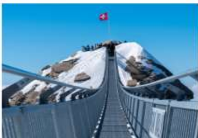
พิชิตยอดเขากิตลิส (Titlis Mt.)

นำทำนโดยสารกระเช้าหมุนไฟฟ้า Rotair Titlis ที่หมุนได้ 360 องศา รุ่นใหม่ล่าสุด ระหว่างชมทิวทัศน์ของ เขอกเขาแอลป์ ที่ มีความสวยงามของยอดเขากิตลิส มีความ สูง 3,028 เมตร ปกคลุมไปด้วยหิมะตลอดทั้ง ปี เป็นยอดเขากิตลิสที่มีนักท่องเที่ยวมาเล่น สกีและทำกิจกรรมบนลานหิมะเป็นจำนวน มาก