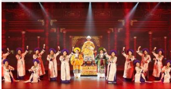
The Heritage Show