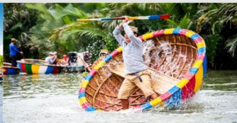
เรือกระดง