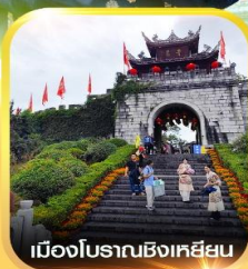
เมืองโบราณชิงเหียน

✈️ คอนเฟิร์มออกเดินทาง ทุกพีเรียด 2 ท่านขึ้นไป