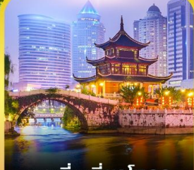
หอเจียเซียงโหลว