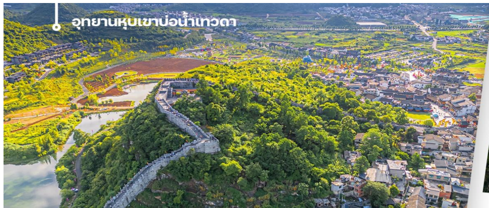
อุทยานหุบเขาบ่อน้ำเทวดา

เช้า 📍 บริการอาหารเช้า ณ ห้องอาหารของโรงแรม (4) นำท่านเดินทางไป อุทยานหุบเขาบ่อน้ำเทวดา หรือ หุบเขาเสินฉวน (รวมรถแบตเตอรี่) เป็นแหล่งท่องเที่ยวที่คุณจะได้สัมผัสกับธรรมชาติ ให้ท่านได้เช็คอินที่จุดชมวิวหุบเขาเสินฉวน ตั้งอยู่ท่ามกลางธรรมชาติที่อุดมสมบูรณ์สวยงามในเขตปกครองตนเองชนกลุ่มน้อยเผ่าเหมียวและปู้อี้ เยือนหนาน ดึงดูดให้นักท่องเที่ยวผู้ชื่นชอบธรรมชาติจากทั่วทุกสารทิศอยากจะมาเยือนหุบเขาแห่งนี้ (รวมค่าขึ้นสะพาน SKYWALK ไว้ในรายการแล้ว)ให้ท่านได้เก็บภาพประทับใจได้เต็มที่