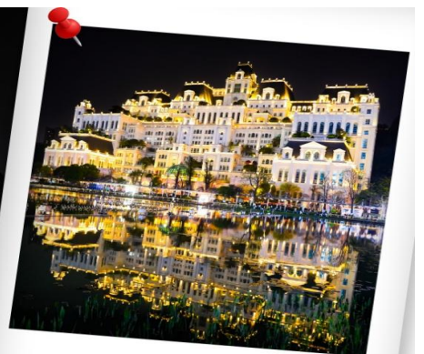
CAQKWE3 กุ้ยหยาง สะพานฮวาเจียง น้ำตกหวงกั๋วซู่ 5 วัน 4 คืน บิน 9AIR (JUN-DEC 26)