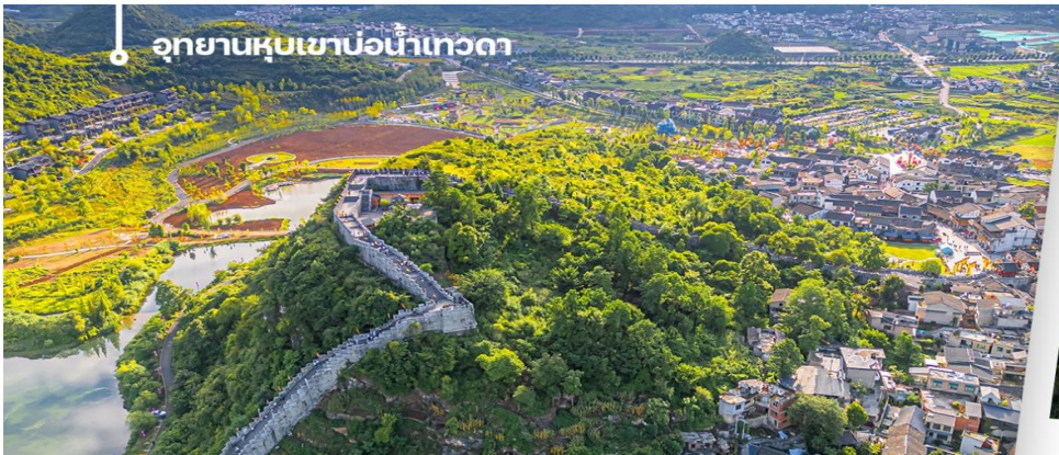
อุทยานหุบเขาบ่อน้ำเทวดา

นำท่านเดินทางไป อุทยานหุบเขาบ่อน้ำเทวดา หรือ หุบเขาเสินฉวน (รวมรถแบตเตอรี่) เป็นแหล่งท่องเที่ยวที่คุณจะได้สัมผัส ต่ำกับธรรมชาติ ให้ท่านได้เช็คอินที่จุดชมวิวหุบเขาเสินฉวน ตั้งอยู่ท่ามกลางธรรมชาติที่อุดมสมบูรณ์สวยงามในเขต ปกครองตนเองของชนกลุ่มน้อยเผ่าเหมียวและปู้อี้ เขียนหนาน ดึงดูดให้นักท่องเที่ยวผู้ชื่นชอบธรรมชาติจากทั่วทุกสารทิศ อยากรจะมาเยือนหุบเขาแห่งนี้ (รวมค่าขึ้นสะพาน SKYWALK ไว้ในรายการแล้วให้ท่านได้เก็บภาพประทับใจได้เต็มที่