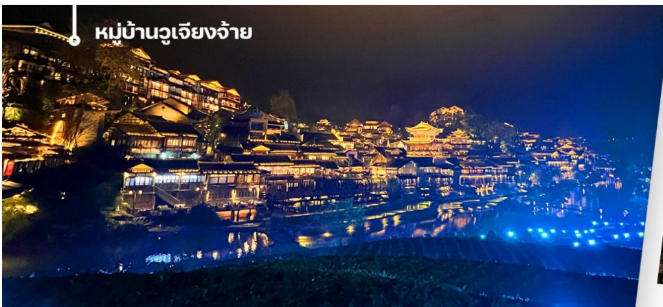
หมู่บ้านวูเจียงจ้าย

จากนั้นนำท่านเดินทางสู่หมู่บ้านวูเจียงจ้าย (Wujiang Zhai) เป็นหมู่บ้านโบราณในมณฑลกุ้ยโจว ประเทศจีน ที่มีความสำคัญทางวัฒนธรรมและเป็นที่ตั้งถิ่นฐานของชนเผ่าต้งและชนเผ่าม้ง หมู่บ้านแห่งนี้ตั้งอยู่ในหุบเขากลางที่รายล้อม