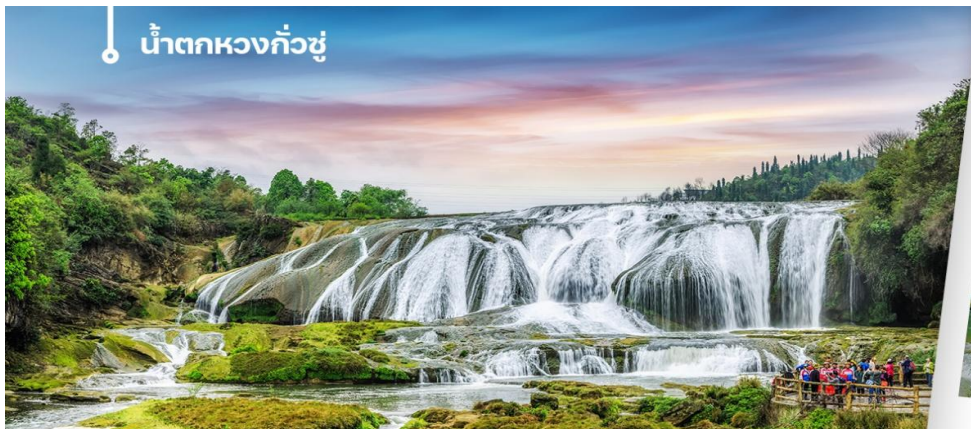
น้ำตกหวงกั๋วชู่

จากนั้นนำท่านเดินทางเมืองอันชุ่น (Anshun) เป็นเมืองระดับจังหวัดที่ตั้งอยู่ทางตะวันตก มีชื่อเสียงด้านธรรมชาติที่อุดมสมบูรณ์ โดยเฉพาะอย่างยิ่ง **น้ำตกหวงกั๋วชู่** ซึ่งเป็นน้ำตกที่ใหญ่ที่สุดแห่งหนึ่งของจีน และยังเป็นศูนย์กลางทางวัฒนธรรมและมีแหล่งท่องเที่ยวทางธรรมชาติระดับ 5A นำท่านชื่นชมความตระการตาการแสดงผลโชว์แสง สี เสียง ที่มีฉากหลังเป็นน้ำตกที่ใหญ่เป็นอันดับ 3 ของโลกเลยทีเดียว