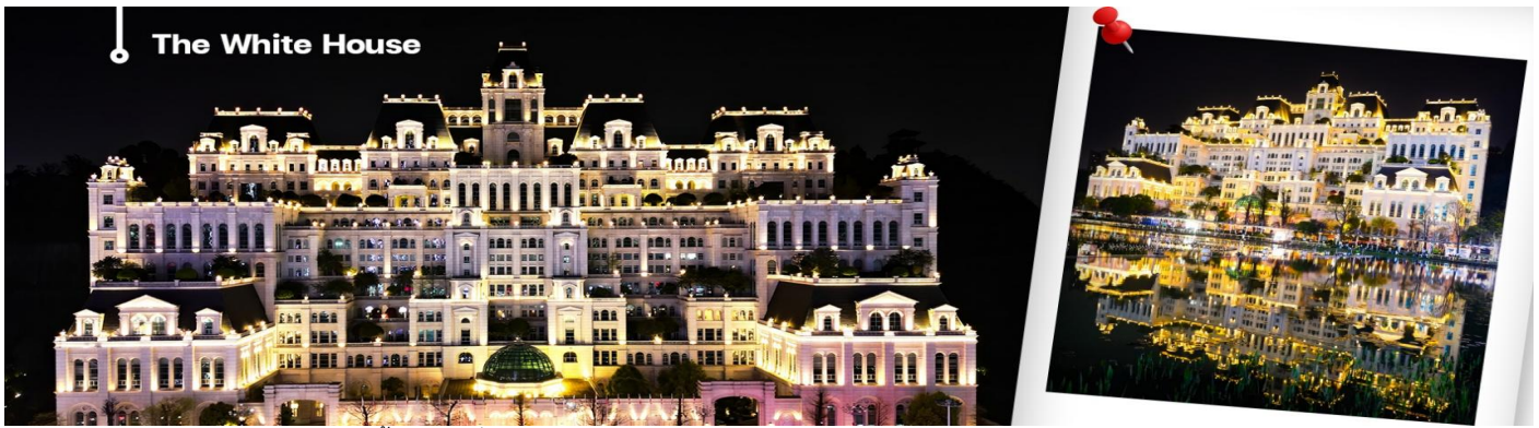
CAQKWE3 กุ้ยหยาง สะพานฮวาเจียง น้ำตกหวงกั๋วซู่ 5 วัน 4 คืน บิน 9AIR (JUN-DEC 26)

นำท่านชม วัดโบราณเจียนหมิง (Qianming Ancient Temple) เป็นวัดพุทธแห่งแรกสร้างขึ้นในสมัยราชวงศ์ถัง มีเจ้าแม่กวนอิม หอระฆังและหอกลอง วัดแห่งนี้มีชื่อเสียงจากสถาปัตยกรรมโบราณอันงดงามและบรรยากาศอันเงียบสงบ ตั้งอยู่บนถนนหยางหมิง ริมน้ำแม่น้ำหนานหมิงในเมืองกุ้ยหยาง วัดเจียนหมิงเป็นหนึ่งในวัดสำคัญระดับชาติ 142 วัดแห่งนี้สร้างขึ้นครั้งแรกในช่วงปลายราชวงศ์หมิงและสร้างขึ้นใหม่ในช่วงสมัยเฉียนหลงของราชวงศ์ชิง ในช่วงยุคเสียนเฟิงของราชวงศ์ชิง วัดเจียนหมิงถูกเปลี่ยนเป็นหอบรรพบุรุษตระกูลซู ในช่วงสาธารณรัฐจีน อาจารย์กวงเมียวได้ย้ายมาที่นี่ ทำให้คัมภีร์พระพุทธศาสนามีจำนวนมากขึ้นและจำนวนผู้ศรัทธาก็เพิ่มมากขึ้น ทำให้ที่นี่เป็นวัดที่สำคัญอันดับต้นๆ จากนั้นนำท่านสู่ หอเจี้ยเซียงโหลว สถานที่ท่องเที่ยวระดับ 3A ของประเทศจีน ถูกสร้างขึ้นในสมัยราชวงศ์หมิง เจี้ยเซียงโหลวที่เห็นกันอยู่ในปัจจุบันเป็นหอที่สร้างขึ้นใหม่ในปีจักรพรรดิซว่ง (ฝูอี) ค.ศ.1909 จากพื้นสะพานจนถึงยอดหลังคาหอ มีความสูงประมาณ 20 เมตร หอมีทั้งหมด 3 ชั้น และในปี 2006 ทางคณะกรรมการได้ประกาศให้หอเจี้ยเซียงโหลวเป็น "สถานที่อนุรักษ์ศิลปวัฒนธรรมสำคัญแห่งชาติ" จากนั้น นำท่านแวะถ่ายรูปด้านนอก ของทำเนียบขาวกุ้ยหยาง" หมายถึง อาคาร "The White House" หรือ กุ้ยหยาง อาร์ต เซ็นเตอร์ ซึ่งเป็นอาคารสีขาวสไตล์ยุโรปที่โดดเด่น ตั้งอยู่ตรงข้ามศูนย์การค้า Huaguoyuan ในเมืองกุ้ยหยาง เป็นสถานที่ท่องเที่ยวที่ได้รับความนิยมและมีชื่อเสียงเรื่องความสวยงามทางสถาปัตยกรรมแบบยุโรปและมีนักท่องเที่ยวแวะมาถ่ายภาพด้านนอกเป็นที่ระลึกตลอดเวลา