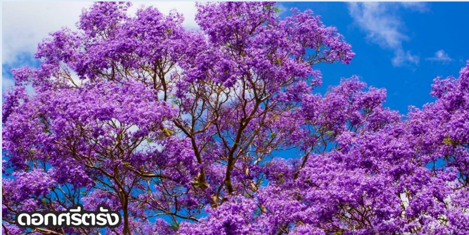
ดอกครีตรั้ง

(ปลายเดือนพฤษภาคม-มิถุนายน): ชมดอกไม้ไฮเดรนเยีย ดอกไฮเดรนเยียที่คุนหมิง ประเทศจีน บานสะพรั่งสวยงามที่สุดในช่วงเดือนมิถุนายน โดยเฉพาะบริเวณทุ่งไฮเดรนเยีย (The Middle Sea Hydrangea Kunming) ซึ่งมีหลากสีทั้งฟ้า ชมพู และม่วง เป็นจุดถ่ายรูปยอดนิยมที่ห้ามพลาด เนื่องจากอากาศที่เย็นสบายและทิวทัศน์ที่งดงาม