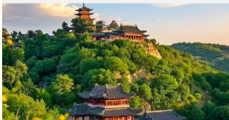
เขาเหยาหวังซาน