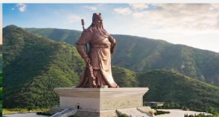
บ้านเกิดท่านกวนจู