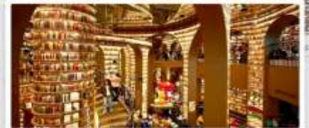
ร้านหนังสือจุงเก๋อ

เดินทางโดย: สายการบินเฉิงตูแอร์ไลน์ (EU)