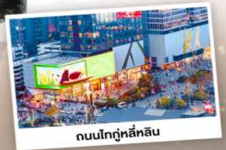
ถนนไท่กู๋หลี่หลิน