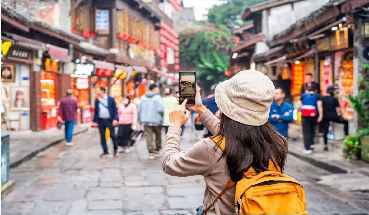
กลางวัน บริการอาหารกลางวัน ณ ภัตตาคารอาหารพื้นเมือง

จากนั้นนำท่านเดินทางสู่ หมู่บ้านโบราณฉีโข่ว (Ciqikou Ancient Town) เป็นหมู่บ้านอนุรักษ์ ทางวัฒนธรรม และเป็นสถานที่ท่องเที่ยวชื่อดังของมหานครฉงชิ่ง ลักษณะก็คล้ายๆ กับตลาดเก่าหรือตลาดโบราณบ้านเรา สำหรับคนที่อยากไปย้อนเวลากลับไปในอดีตก็ต้องไปเยือน เพราะที่นี่ยังคงรักษาวิถีชีวิต รวมทั้งสะท้อนรากเหง้าดั้งเดิมของเมืองไว้ได้อย่างดีเยี่ยม ไม่ว่าจะเป็นตึกoramบ้านช่องที่มีรูปทรงโบราณ แหล่งผลิตสินค้า และอาหารพื้นเมืองที่สืบทอดกิจการต่อกันมาหลายรุ่น