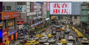
ทวนอิมเจียว

*ทางบริษัทฯ ขอสงวนสิทธิ์ในการสลับโปรแกรมทัวร์ตามความเหมาะสมขึ้นอยู่กับสถานการณ์หน้างาน โดยคำนึงถึงผลประโยชน์ของลูกค้าเป็นสำคัญ