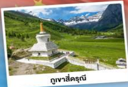
กู๋เจาสื่อครุณี

เที่ยว 2 อุทยาน กู๋เจาสื่อครุณี & ปี้ผิงโกว เดินชมหมีแพนด้าสุดน่ารัก ใกล้ชิดกับแพนด้าแดง