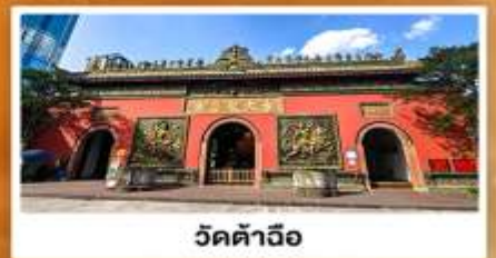
วัดคำฉือ