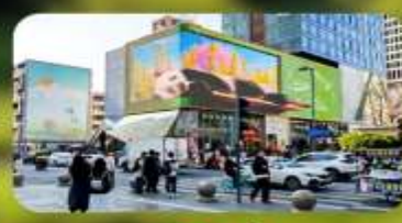
ไท่กุ่หลี่