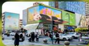
ไท่กุ่หลี่