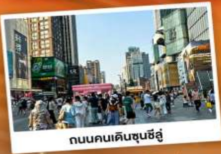
ถนนคนเดินชุนชิว

"สวีทเซอร์แลนด์เมือง" แคนมิงกร แหล่งท่องเที่ยวทางธรรมชาติระดับ 4A