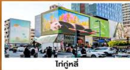
โก่กู๋หลี่