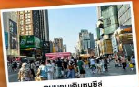
ถนนคนเดินชุนชิว

"สวีตเซอร์แคแอนด์เนียง" แคนมิงกร แหล่งท่องเที่ยวทางธรรมชาติระดับ 4A