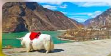
กะเลสาบเต๋อซี