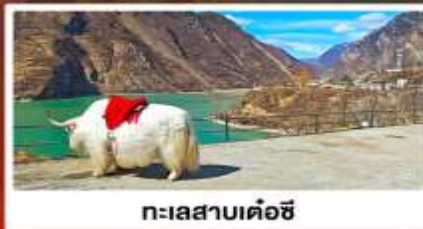
ทะเลสาบเค่อซี