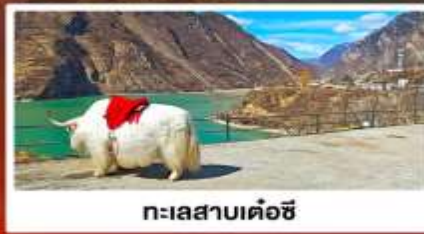
ทะเลสาบเค่อซี