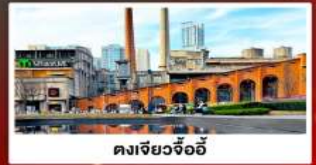
ตงเจียวจื่ออี้