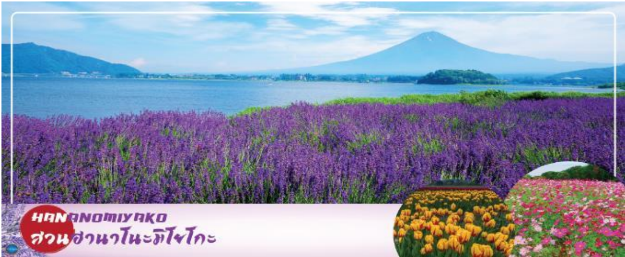
HANANOMIYAKO สวนसानะโนะมียาโกะ

08.00 น. เดินทางถึง ท่าอากาศยานนานาชาตินาริตะ ประเทศญี่ปุ่น นำท่านผ่านขั้นตอนการตรวจคนเข้าเมืองและศุลกากร เรียบร้อยแล้ว (เวลาที่ญี่ปุ่น เร็วกว่าเมืองไทย 2 ชั่วโมง กรุณาปรับนาฬิกาของท่านเพื่อความสะดวกในการนัดหมายเวลา) ***สำคัญมาก!! ประเทศญี่ปุ่นไม่อนุญาตให้นำอาหารสด จำพวก เนื้อสัตว์ พืช ผัก ผลไม้ เข้าประเทศ หากฝ่าฝืนมีโทษปรับและจับ